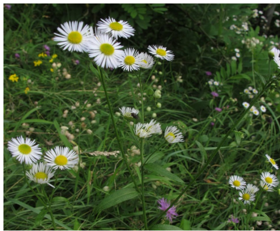
Erigeron annuus