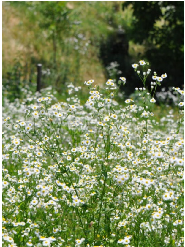
Erigeron annuus